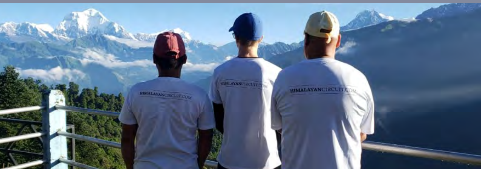
Kulturelle Highlights der nepalesischen Metropole