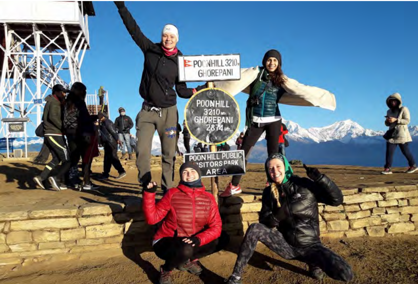
Ziel der Wanderung: Poonhill